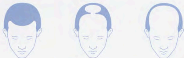
Etapas en la alopecia masculina

Medicamentos: algunos medicamentos utilizados en quimioterapia hacen que las células capilares detengan su división. Se puede perder hasta el 90% del cabello, pero en la mayoría de los casos vuelve a crecer cuando el tratamiento finaliza. También algunos medicamentos pueden producir caída del cabello (hipocolesterolémiantes, antiulcerosos, anticoagulantes, antigotosos, antiartríticos, derivados de la vitamina A, antiepilépticos, betabloqueantes, antitiroideos), así como las hormonas masculinas (esteroides anabolizantes).