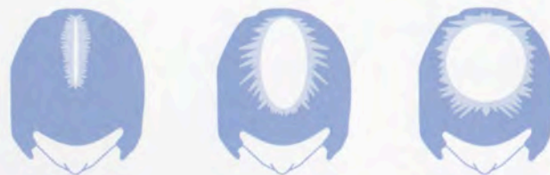
Etapas en la alopecia femenina

Alopecia areata: afecta a hombres y mujeres de todas las edades, aunque más a los jóvenes. Los folículos afectados disminuyen su producción capilar, se vuelven muy pequeños y producen un cabello que apenas se ve. A veces se puede perder todo el cabello de la cabeza o la totalidad del vello corporal.