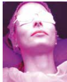
Aplicación de luz