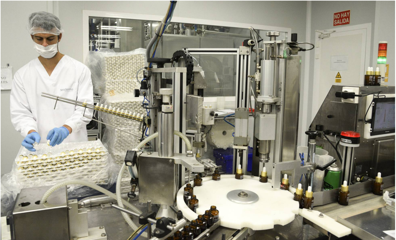
Un trabajador de Sesderma en el laboratorio de Valencia